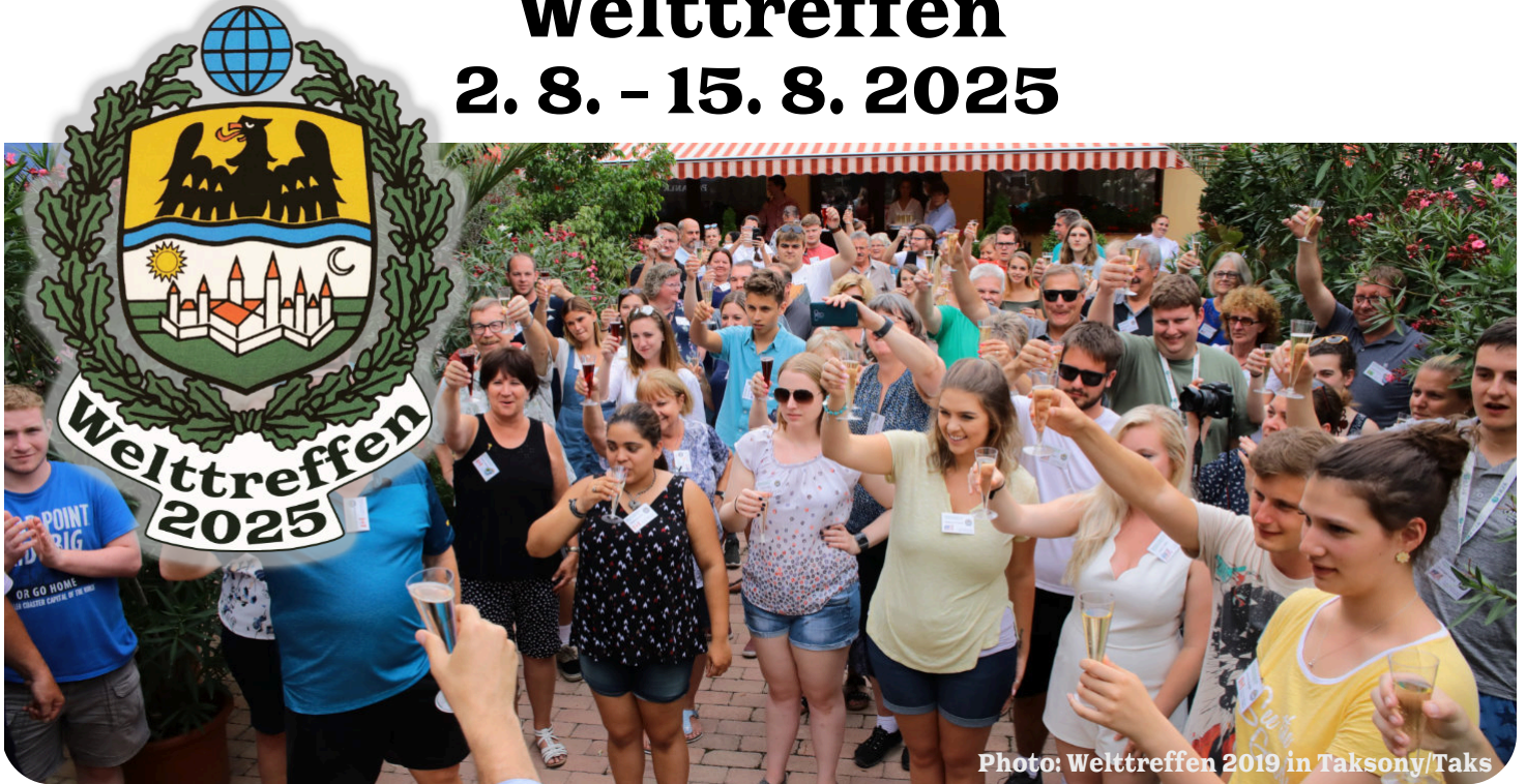
Photo: Welttreffen 2019 in Taksony/Taks